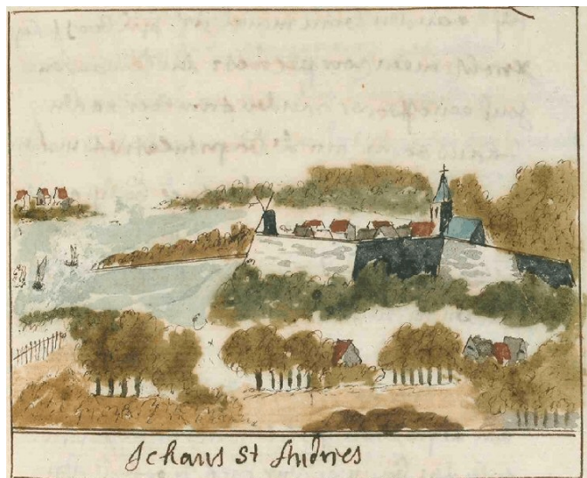
Tekeningen van Andries Schoemaker uit Beschryving van Gelderland